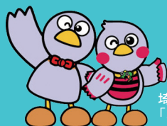
埼玉県のマスコット 「コパトン」&「さいたまっち」

「在宅ワークってどのような働き方なんだろう？」 「どんな仕事があるの？」 「在宅ワーカーに必要なスキルは？」など、 在宅ワークの”今”を 知りたいという方のための講座です。